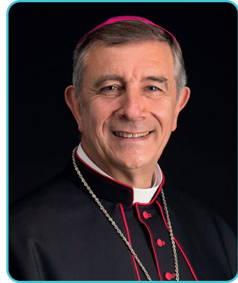
† José Luis Retana Gozalo Obispo de Salamanca

Uno de los problemas más importantes, si no el mayor, es el de las vocaciones al presbiterado y a la vida consagrada. «Toda la renovación de la Iglesia consiste esencialmente en el aumento de la fidelidad a su vocación» (EG 26).